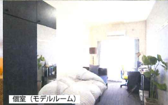
個室 (モデルルーム)