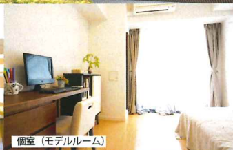
個室 (モデルルーム)